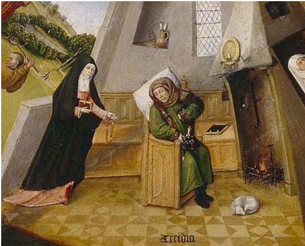
J. Bosch, Les sept péchés capitaux : acédie, vers 1450