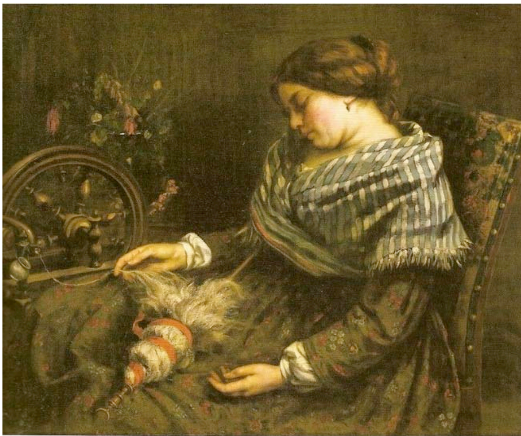
G. Courbet, La fileuse endormie (1853)